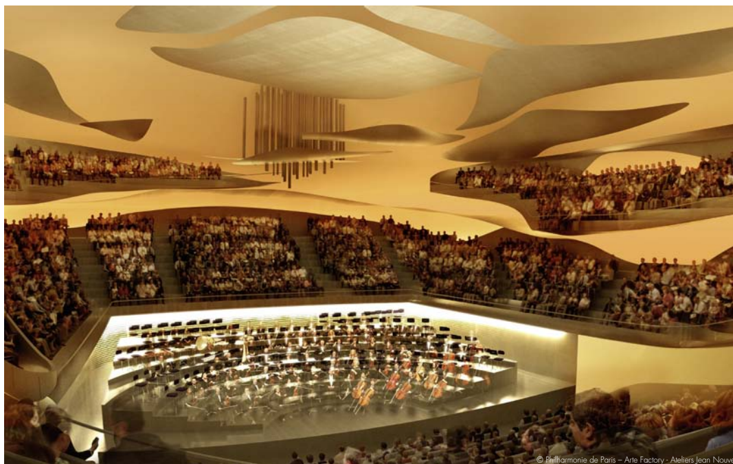
© Philharmonie de Paris - Arte Factory - Ateliers Jean Nouvel