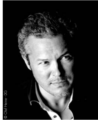
Vadim Repin FRANCE