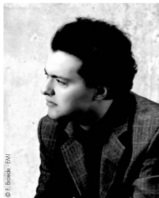
Evgeny Kissin FRANCE