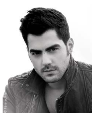
Miloš Karadaglić FRANCE