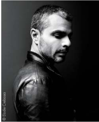
Laurent Korcia WORLD