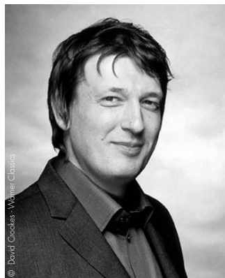
Boris Berezovsky WORLD