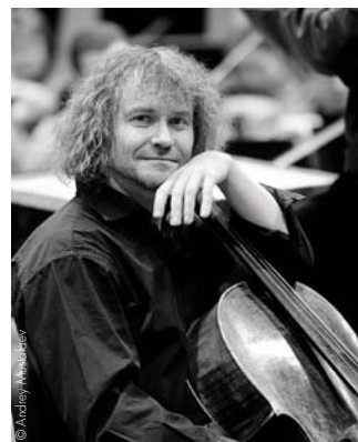
Alexander Kniazev WORLD