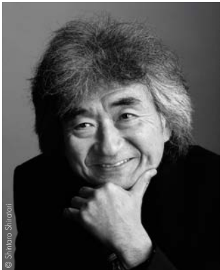
Seiji Ozawa FRANCE